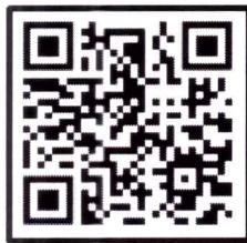
Ensino Infantil As Aventuras de Lelé – Hora da Vacina